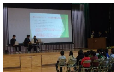
【中学生 いじめ研究発表】

未来フォーラム終了後に、いじめ見逃し0スクール集会を行いました。この集会では、なぜ、いじめが起こるのか、そして、いじめをしないようにするには、普段の生活の中でどのようなことに気をつけたらよいのか、「いじめを許さない、いじめを見逃さない」ことの大切さを確認しました。