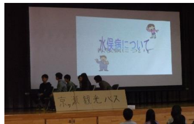
【6年生 水俣病についての発表】

11月27日(火)京ヶ瀬中学校で「あがの子ども未来フォーラム」を小中合同(5・6年児童と中学1～3年全員参加)で行いました。このフォーラムのねらいは、地域の人やもの、ことがらに触れて学んだ成果を発表しあい、ふるさと京ヶ瀬に愛着をもち、阿賀野市の未来を創造する児童・生徒の成長をうながすことです。