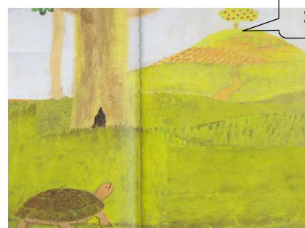
【②】常にゴールを見ているカメ

2学期も、今年も後わずかです。一日一日を、これまで同様に大切に、子どもたち一人一人の目標やめあての達成感を味わわせることができるよう、全職員で取り組みます。どうぞ引き続き保護者・地域の皆様のご理解・ご協力をよろしくお願いいたします。